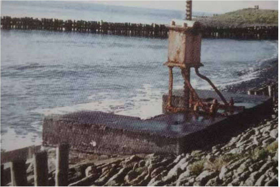
Foto van het Peijloot en de bediening van de schuif die bij calamiteiten gesloten kon worden (beide zijn helaas verdwenen)

Enige tijd na de Ramp van 1953 is de sluis gedempt en is de afwatering van de Burghse Polder geregeld via een nieuwe duiker onder de Meeldijk. Hierdoor wordt het overtollige water door de polder Schouwen naar het gemaal Prommelsluis geleid.