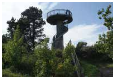
Uitkijktoren Boswachterij Westerschouwen

De 'Boswachterij Westerschouwen' is het grootste bos van Zeeland en ligt ten westen van Burghsluis. Het is een heuvelachtig duinlandschap, met zandverstuivingen, valleien en duinweiden. Vogelrijke bosranden met vele soorten bomen en planten. Een van de mooiste gebieden van Zeeland. Het is een schitterend fiets- en wandelgebied. Je hoort voortdurend de branding. De wilde kamperfoelie ruikt heerlijk na een regenbui. Overall ritselt leven dat je vanaf de vele gemarkeerde wandelroutes of vanuit de schuilhut of uitkijktoren kunt bespieden. Ook het bezoekerscentrum is zeer de moeite van een bezoekje waard.