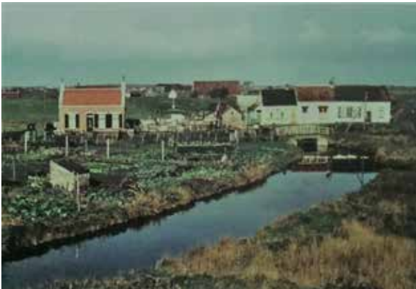
Dit was het uitwateringskanaal door het Oude Sluusje

Enige tijd na de Ramp van 1953 is de sluis gedempt en is de afwatering van de Burghse Polder geregeld via een nieuwe duiker onder de Meeldijk. Hierdoor wordt het overtollige water door de polder Schouwen naar het gemaal Prommelsluis geleid.