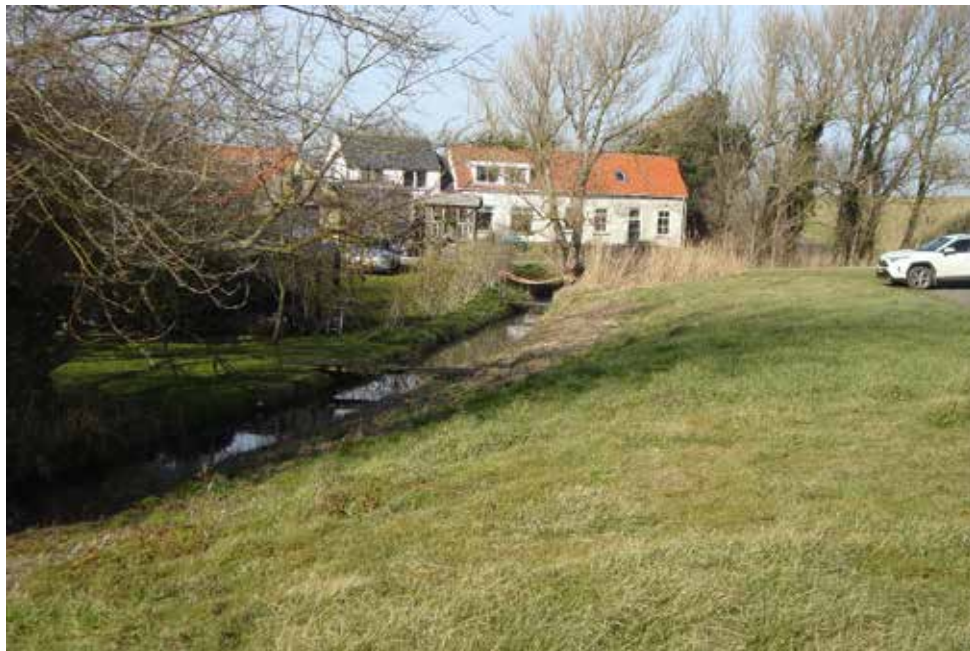
Dit is er nu nog van over.

Tegenwoordig is hier nog maar weinig van terug te vinden. Als je op de zeedijk staat met je neus in noordelijke richting zie je alleen een smal slotje. In de jaren zeventig van de vorige eeuw is de waterafvoer zoals deze verdwenen.